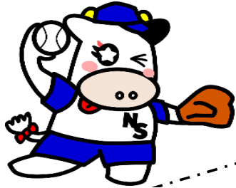
那須塩原市ブランドキャラクターみるひい